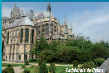
Cathédrale de Reims