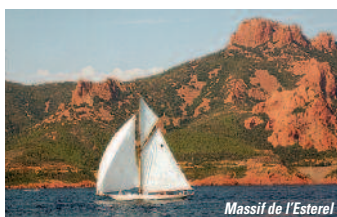
Massif de l'Estérel

J8. TOULOUSE, REGION : Trajet retour vers Bordeaux, ✕ en cours de route