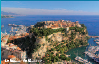
Le Rocher de Monaco