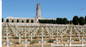
Ossuaire de Douaumont

J3. VERDUN, REIMS, REGION : départ de Verdun en direction de Reims. Promenade sur la route des vins, dans le vignoble de la Montagne de Reims et visite chez un producteur de vin de champagne. Reims, découverte de la cathédrale, ✕. L'après-midi, voyage retour par Paris, Chartres, Le Mans.